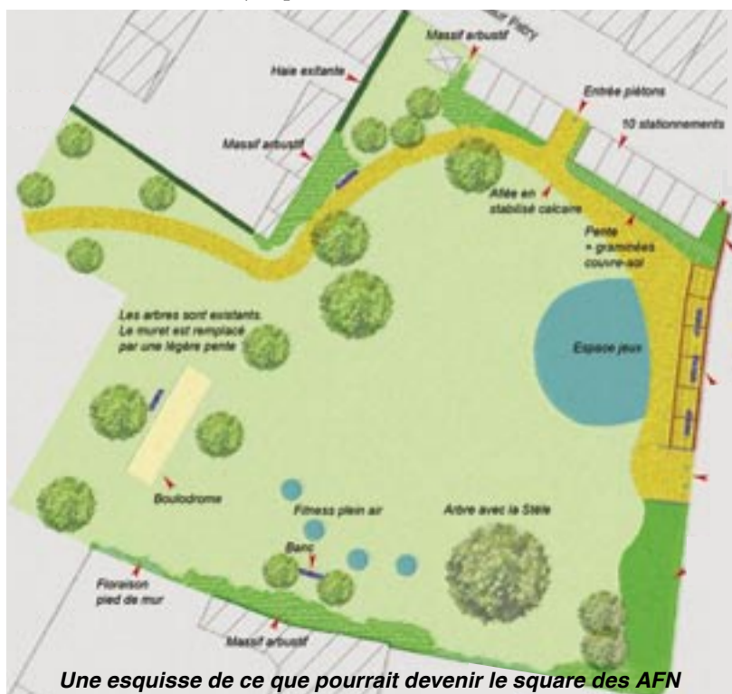
Une esquisse de ce que pourrait devenir le square des AFN

Le projet, bien avancé, n'est pas tout à fait finalisé. Vous pouvez faire part de vos remarques, souhaits, suggestions auprès du secrétariat des services techniques.