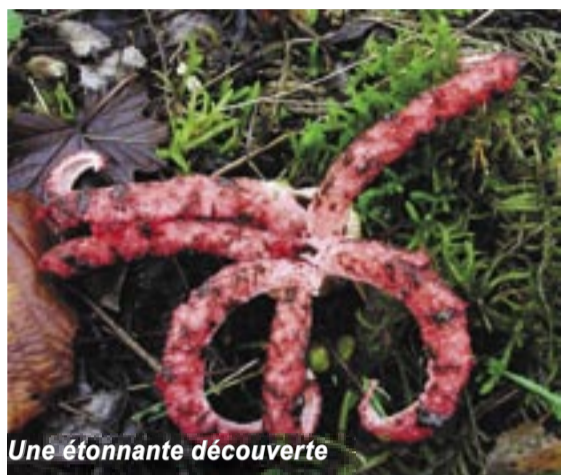
Une étonnante découverte

Le Carroir Jodel 37240 Le Louroux 02 47 53 22 57 06 37 18 26 85