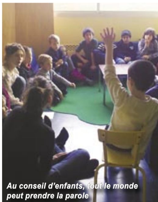
Au conseil d'enfants, tout le monde peut prendre la parole

Dans les accueils de loisirs (ALSH) municipaux, le conseil d'enfants est un moment important où chacun peut donner son avis et faire des propositions.