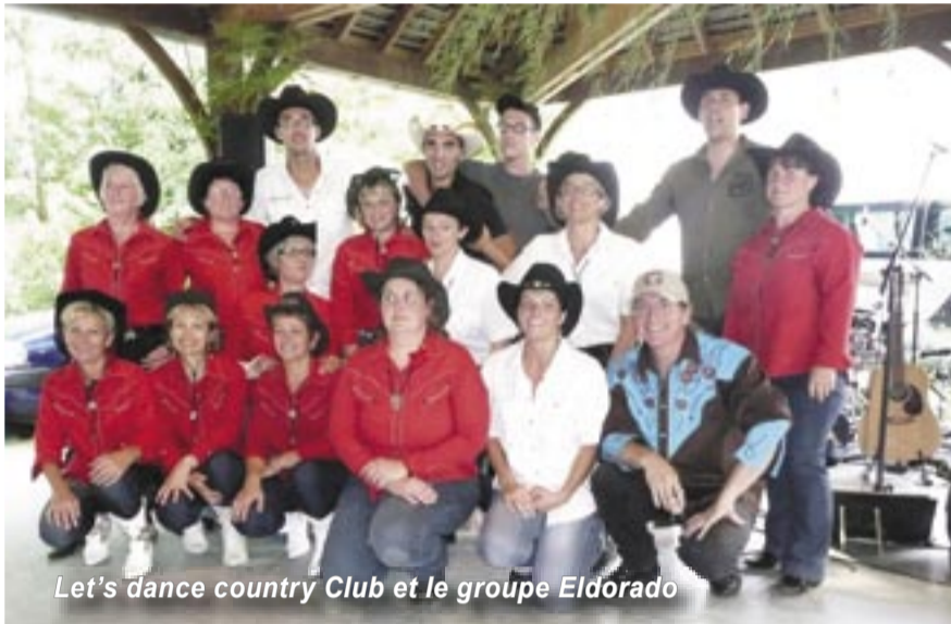
Let's dance country Club et le groupe Eldorado

Le prochain bal, le samedi 29 octobre 2011 sera un bal-concert avec le groupe Little Creek (bluegrass et country).