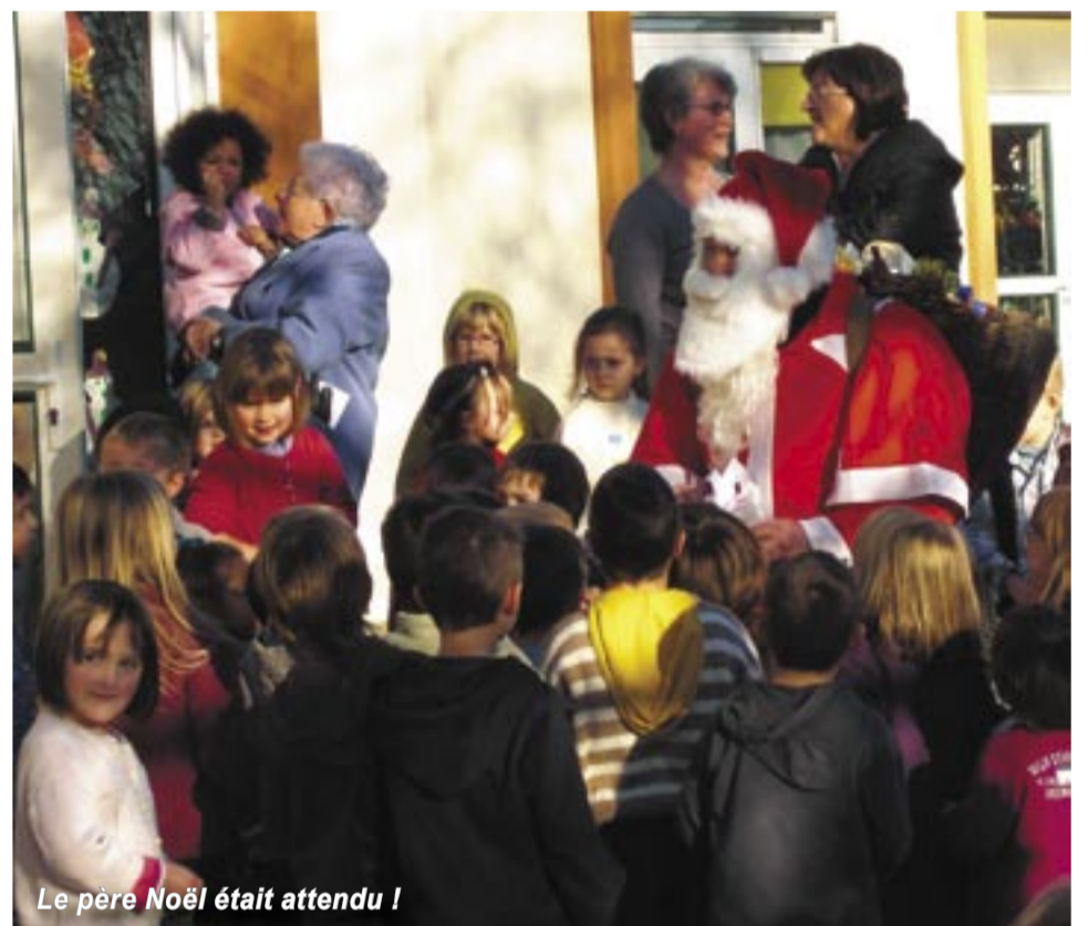
Le père Noël était attendu !