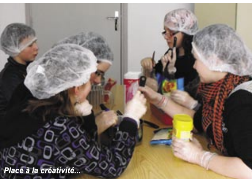
Place à la créativité...

l o c a u x (fromages, confitures...). N o u s profitons de la parution de cet article pour remercier nos « clients » réguliers (une vingtaine) ainsi que tous ceux qui ont permis la mise en place de ce projet.