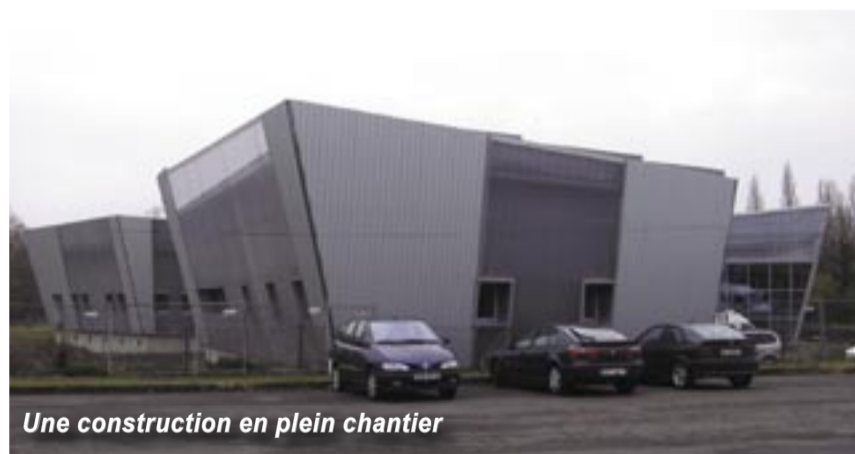
Une construction en plein chantier

Comme ce fut le cas à Tours pour le « Vinci », laissons le lieu ouvrir et fonctionner pour en découvrir tout l'intérêt et s'apercevoir qu'il ira bien à notre ville et lui apportera une nouvelle notoriété.