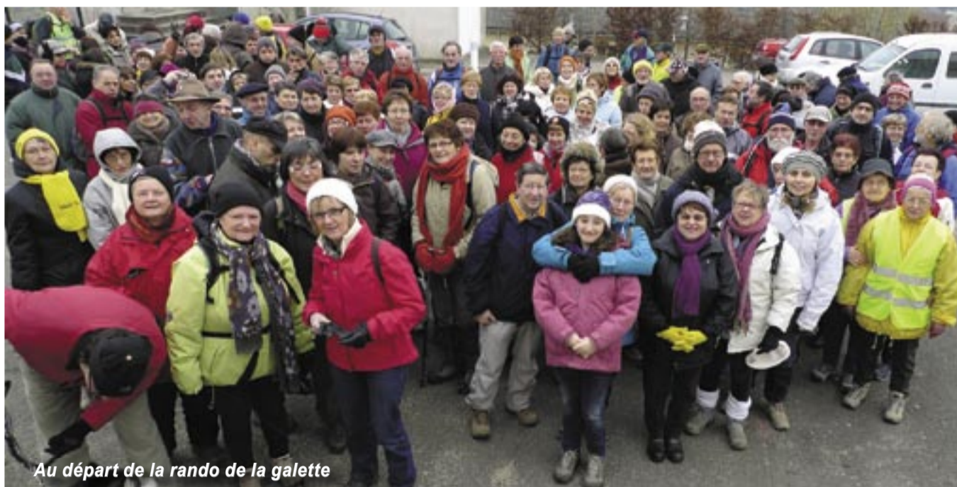
Au départ de la rando de la galette

Le rando-club entame sa sixième année de fonctionnement, il poursuit ses activités et manifestations habituelles, déjà bien rôdées. L'effectif des licenciés reste stable, même si certains ont dû s'arrêter pour des problèmes physiques.