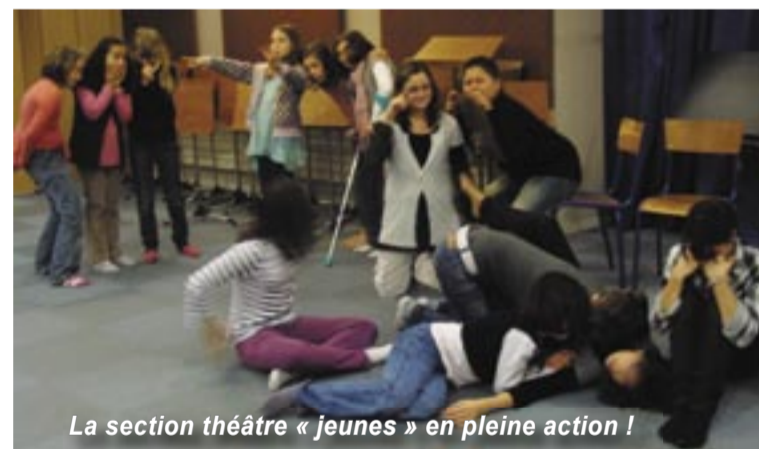
La section théâtre « jeunes » en pleine action !