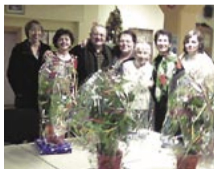
L'équipe de l'A.S.E.P.T., salariées et bénévoles à votre service

A.S.E.P.T. Rue du 11 Novembre 37800 Sainte-Maure de Touraine Tel : 02 47 65 67 50 Fax : 02 47 65 54 30 E-mail : asept@laposte.net Du lundi au vendredi 9 h à 12 h – 14 h à 17 h