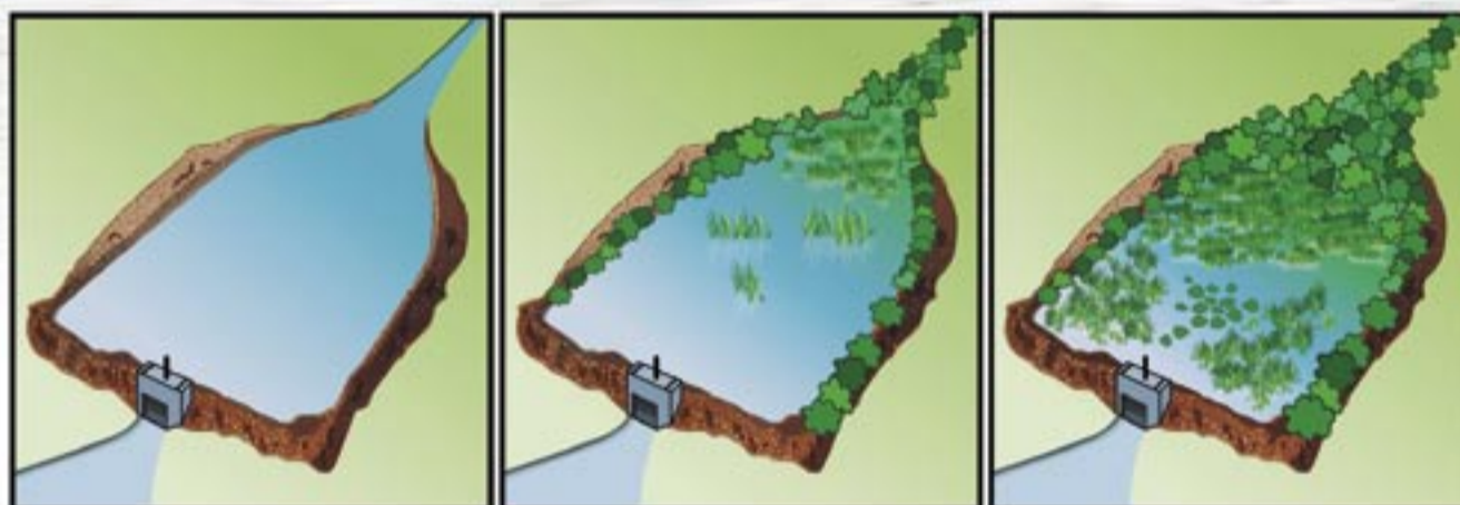
Représentation schématique de l'évolution progressive des étangs sans intervention extérieure

Année après année, la Manse a charrié des sédiments issus du ruissellement des eaux, pendant les épisodes de crues. Ces boues se sont accumulées dans l'étang. A cela s'ajoute l'érosion des berges, trop peu végétalisées, qui finissent par s'effondrer. La réalisation d'un curage par la commune en 1998 (400 000 francs), a permis de nettoyer l'étang, mais le phénomène d'envasement continue, inévitablement. A terme, s'il n'est pas curé régulièrement, l'étang se comblera totalement, se transformant progressivement en zone humide. C'est le cas actuellement dans la partie amont du plan d'eau.