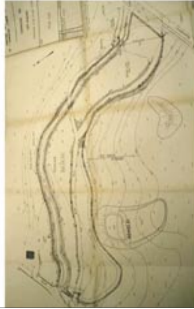
À l'origine, la Manse s'écoulait en lieu et place de l'actuel plan d'eau

Deux solutions peuvent convenir en l'état actuel de la législation. Elles diffèrent par leur durabilité, leur coût et leur impact sur les habitudes locales liées au site.