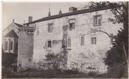
Vue (ancienne) de l'arrière du château

Au XIV e siècle, la famille de Craon (Amaury III de Craon devient seigneur du lieu par son mariage avec Isabelle de Sainte-Maure) procède à une nouvelle reconstruction du château, dont il reste des traces visibles : la tour carrée du sud-est, le mur extérieur du logis à l'est, l'enceinte sud avec sa tour demi-cylindrique et la porte fortifiée et, au nord-est, une tour ronde en partie arasée.