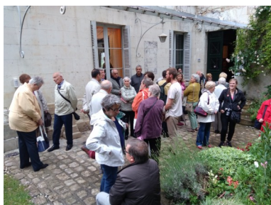
Sortie à Loches le 12 juin 2016