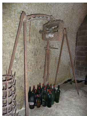
La Vigne : thème de la conférence du 18 mars 2017