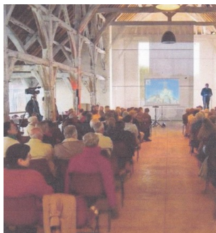
In cadre de prestige pour une journée très savante.