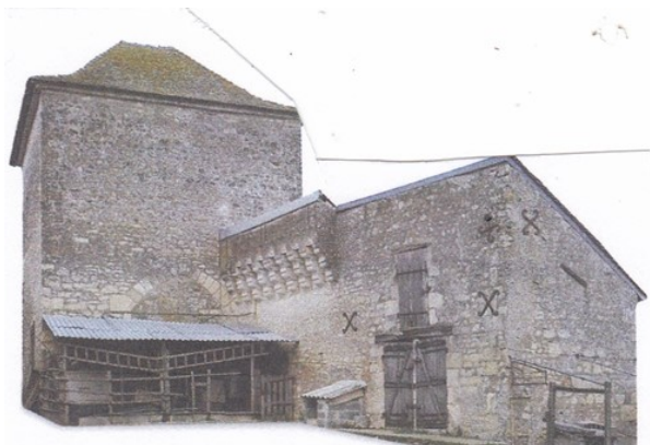
La ferme de la Roche Ramé

Le fief relevant du château de Nouâtre appartient en 1398 à la famille de la Jaille qui compte au moins trois chevaliers croisés. En 1527 est édiflée une chapelle dédiée à Sainte Barbe. Cette construction, aujourd'hui disparue, était, en 1817, "sans charpente, ni couverture"