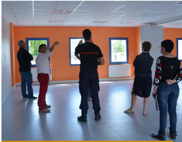
VISITE DE LA COMMISSION DE SÉCURITÉ