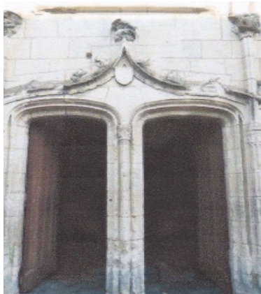
Entrée de l'église Saint-Blaise

L'actuelle église Saint Blaise du XV e siècle avait succédé à celle du XI e . Sa façade présente une élégante ouverture à double anse de panier surmontée d'une accolade amortie d'un cul-de-lampe et d'une grande fenêtre en tiers-point; porte et fenêtre sont encadrées par deux colonnes coiffées d'un pinacle et coiffées de deux niches, vides. Le clocher d'ardoises est à huit pans. A l'intérieur, on admirera, au nord de la nef, la chapelle seigneuriale dotée d'une ouverture en biais, faite au cours de la Renaissance, pour permettre au seigneur de suivre la messe sans se mêler à la foule.