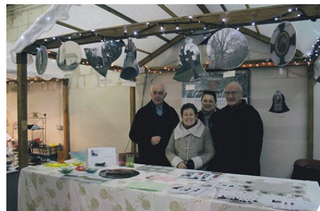
Nos dignes représentants