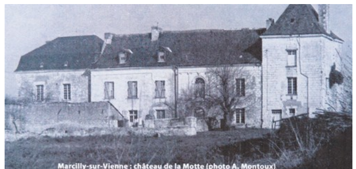
Marcilly-sur-Vienne : château de la Motte

Les douves et la fuie n'existent plus et l'édifice actuel est un corps de logis en quatre parties, avec tour carrée au sud-ouest, un pavillon à toit à la Mansart au nord et une partie centrale (l'ancienne mairie) ornée de quatre pilastres doriques et d'une porte en plein cintre