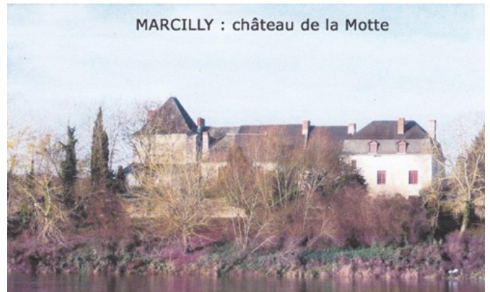
MARCILLY : château de la Motte

Cet édifice s'appela, du XI e au XVIII e siècle, "La Motte-au-fils-Yvon", du nom de l'une des premières familles occupantes. Du XIV e au XVI e siècle, il est aux mains de la famille de la