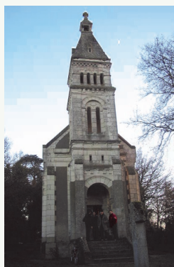
LA CHAPELLE DES VIERGES

Après une matinée passée à l'Office de Tourisme, à la Chapelle des Vierges, au village de Grand Vaux, l'après-midi a été consacrée à la visite du centre-ville historique. 20 participants. Excellents contacts.